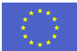
FONDO EUROPEO AGRICOLO PER LO SVILUPPO RURALE: